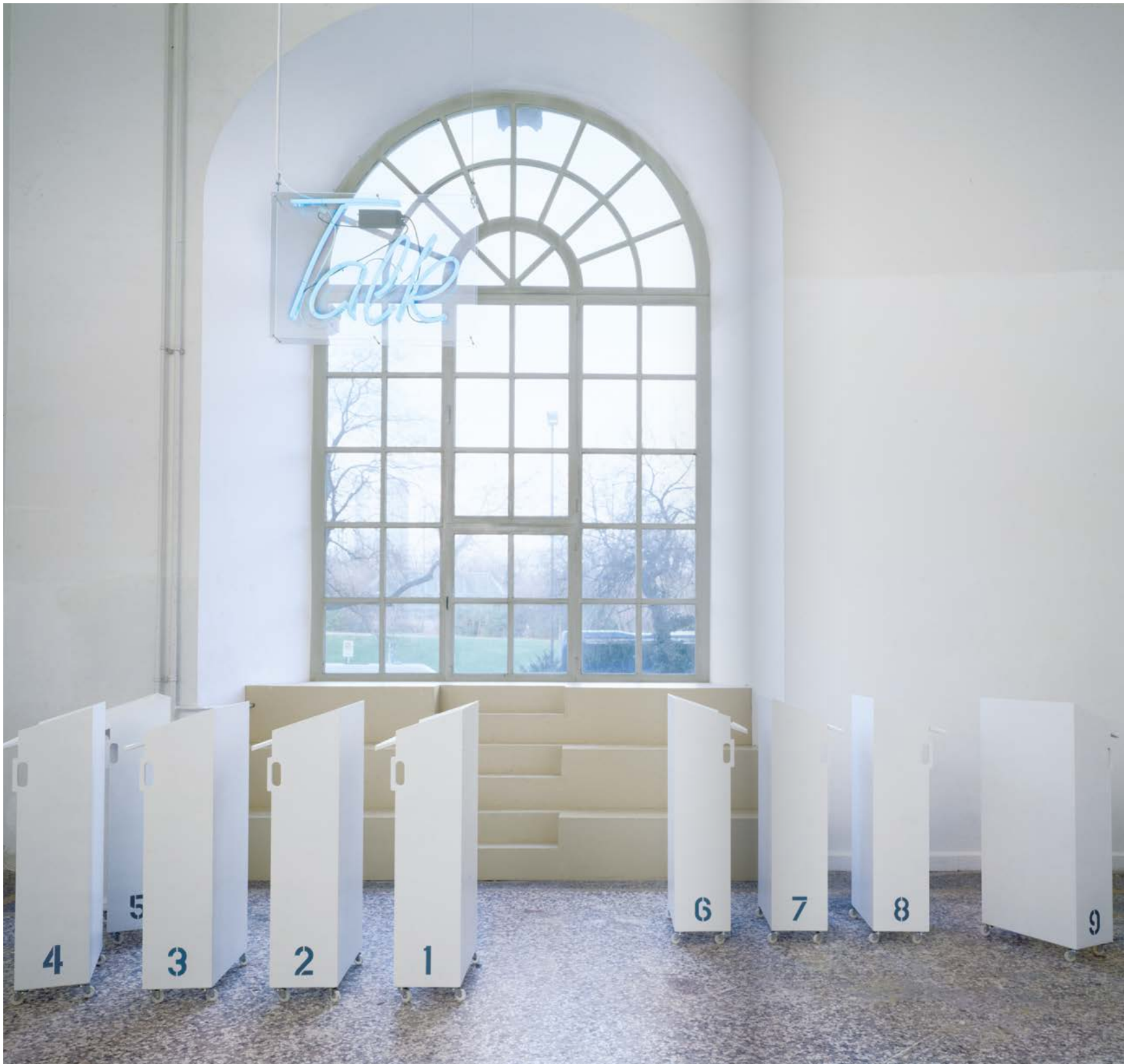
Talk 2004 Neon | MDF | Lack | Kunststoffrollen Größe variabel Rundgang, Kunstakademie Düsseldorf