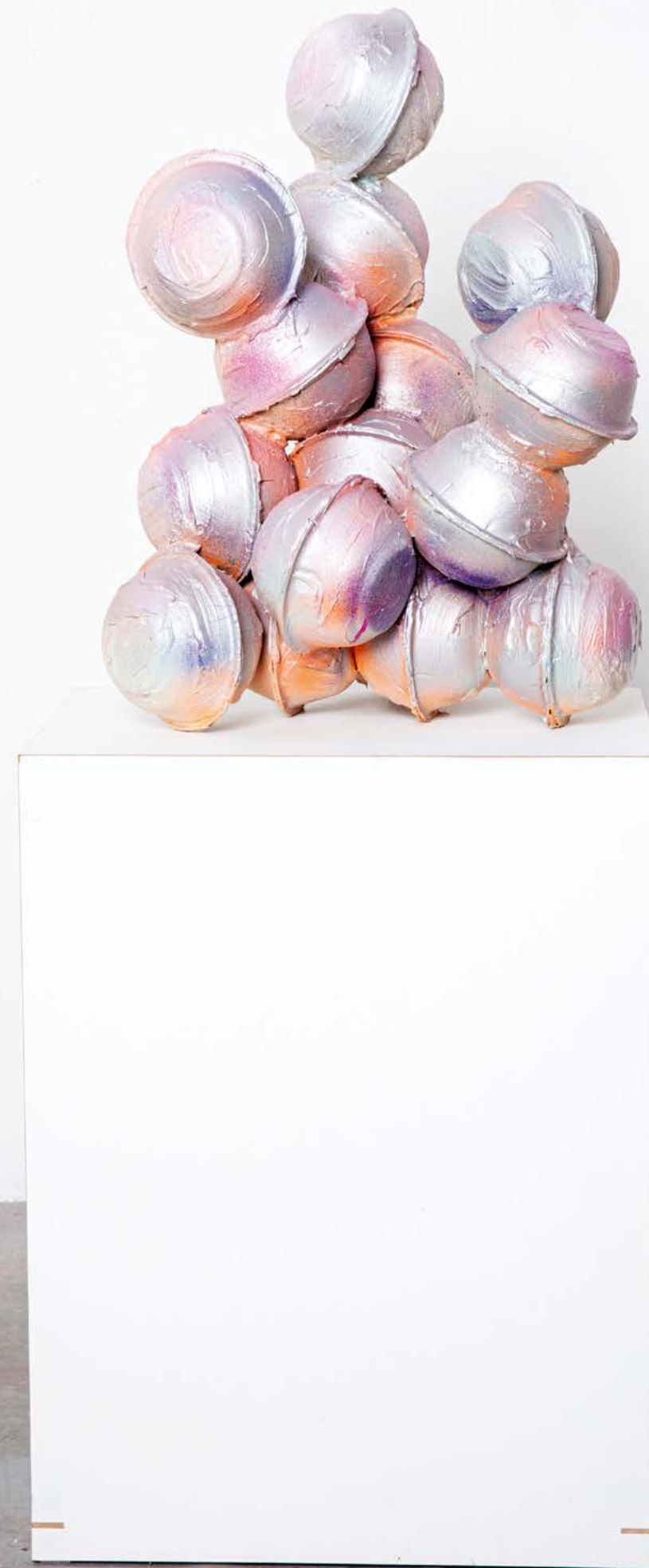
MOTHER OF PEARL