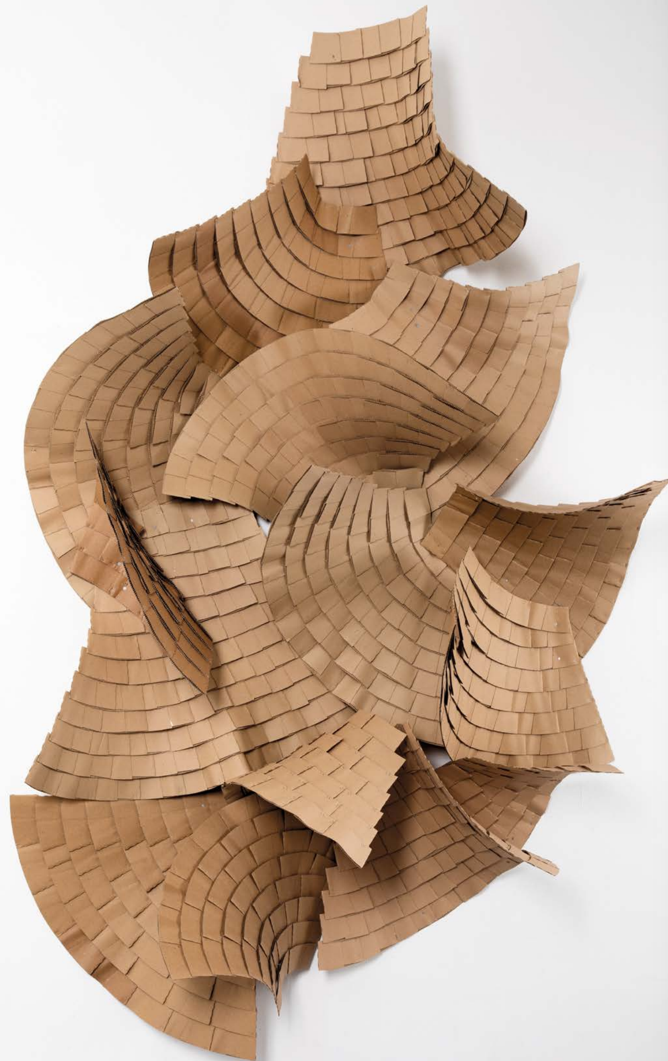
NACHTS SIND ES TIERE 69