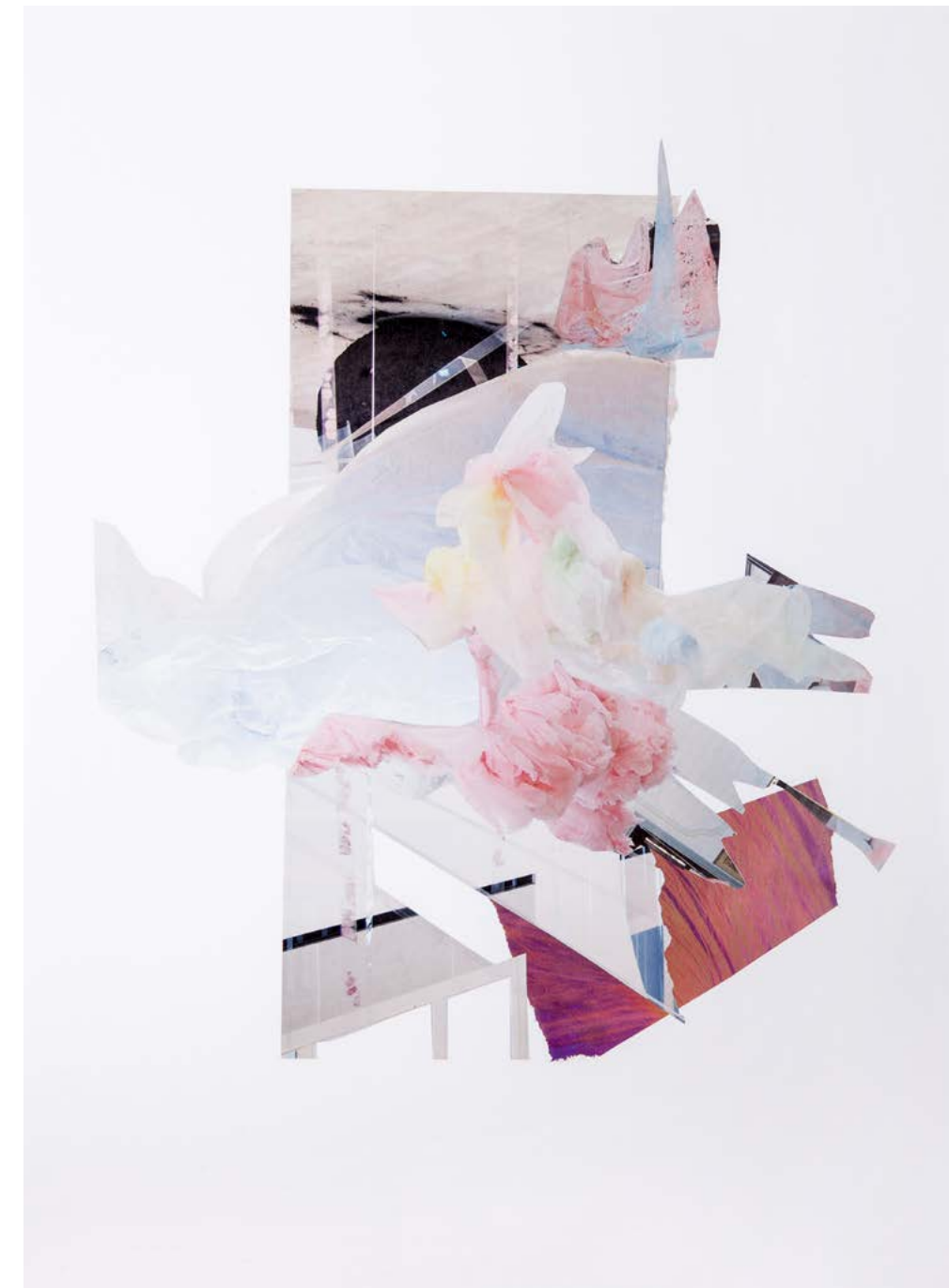
STIL UND SUBSTANZ