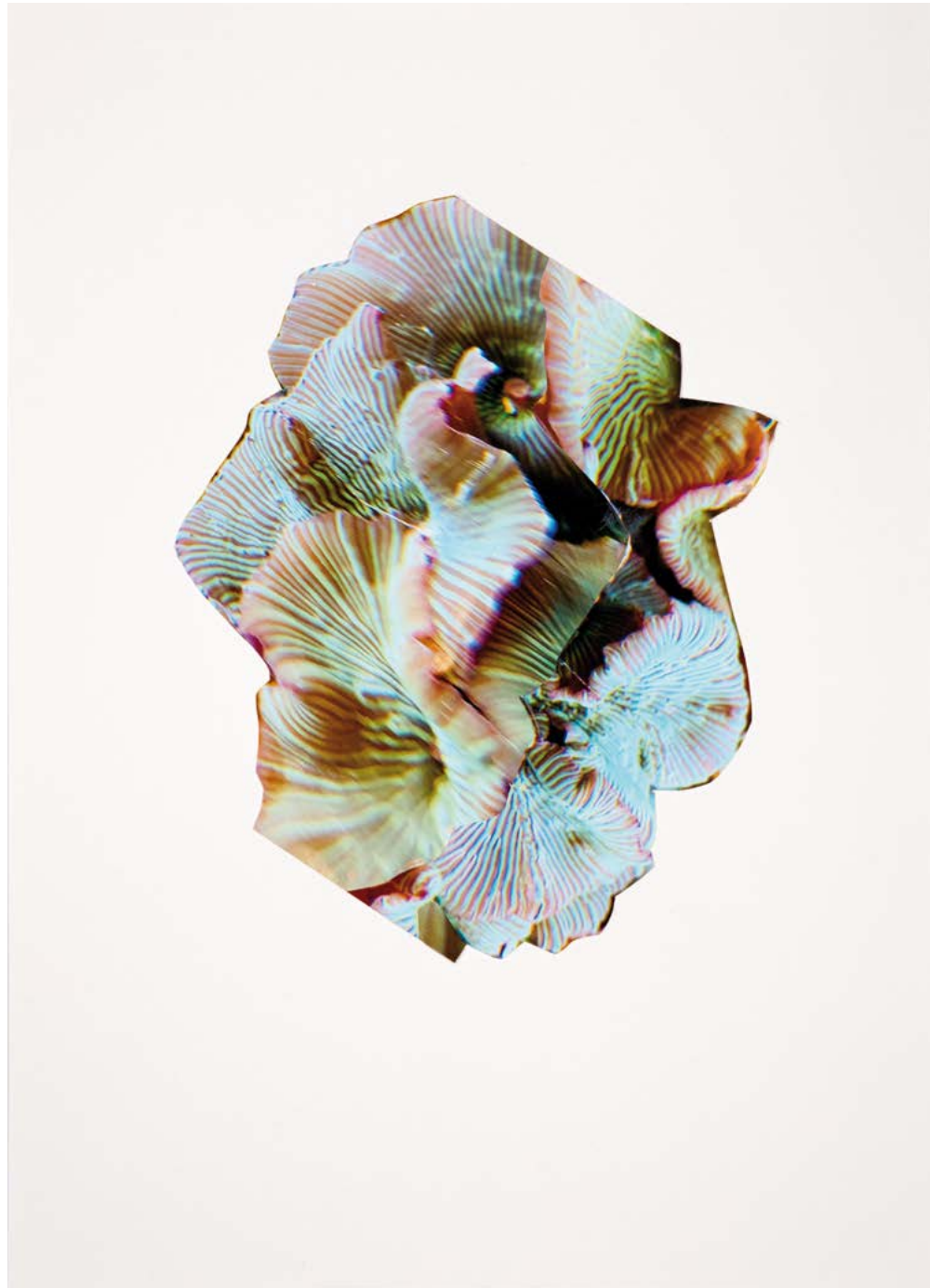
MOTHER OF PEARL 2