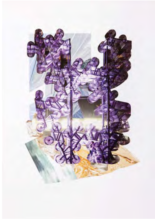
ANARCHOS AUF RÄDERN