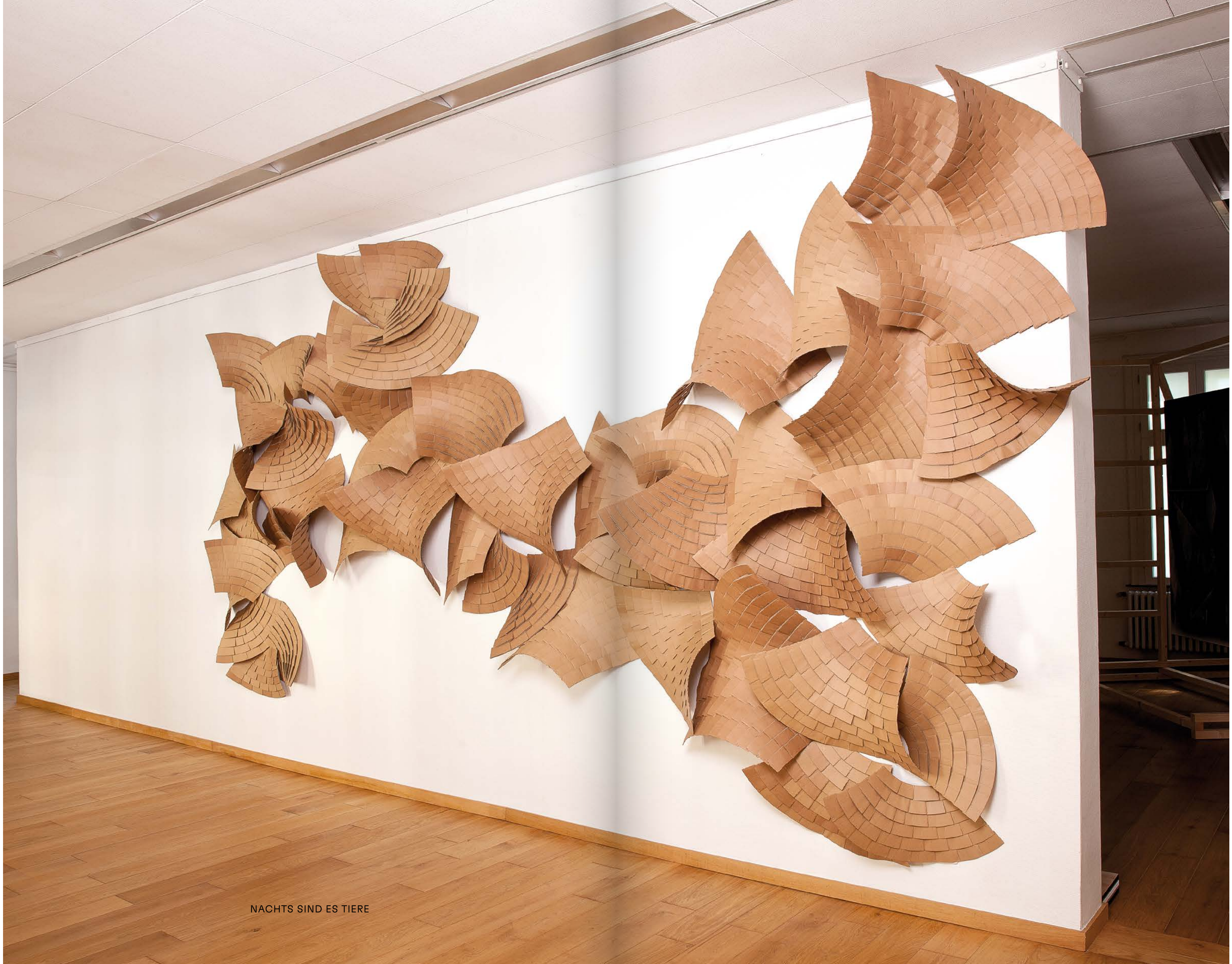
NACHTS SIND ES TIERE