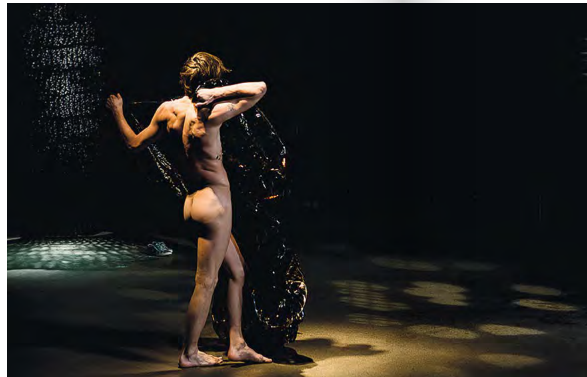
BÜHNENBILD UND REQUISITEN FÜR »DON NADIE«, COOPERATIVA MAURA MORALES