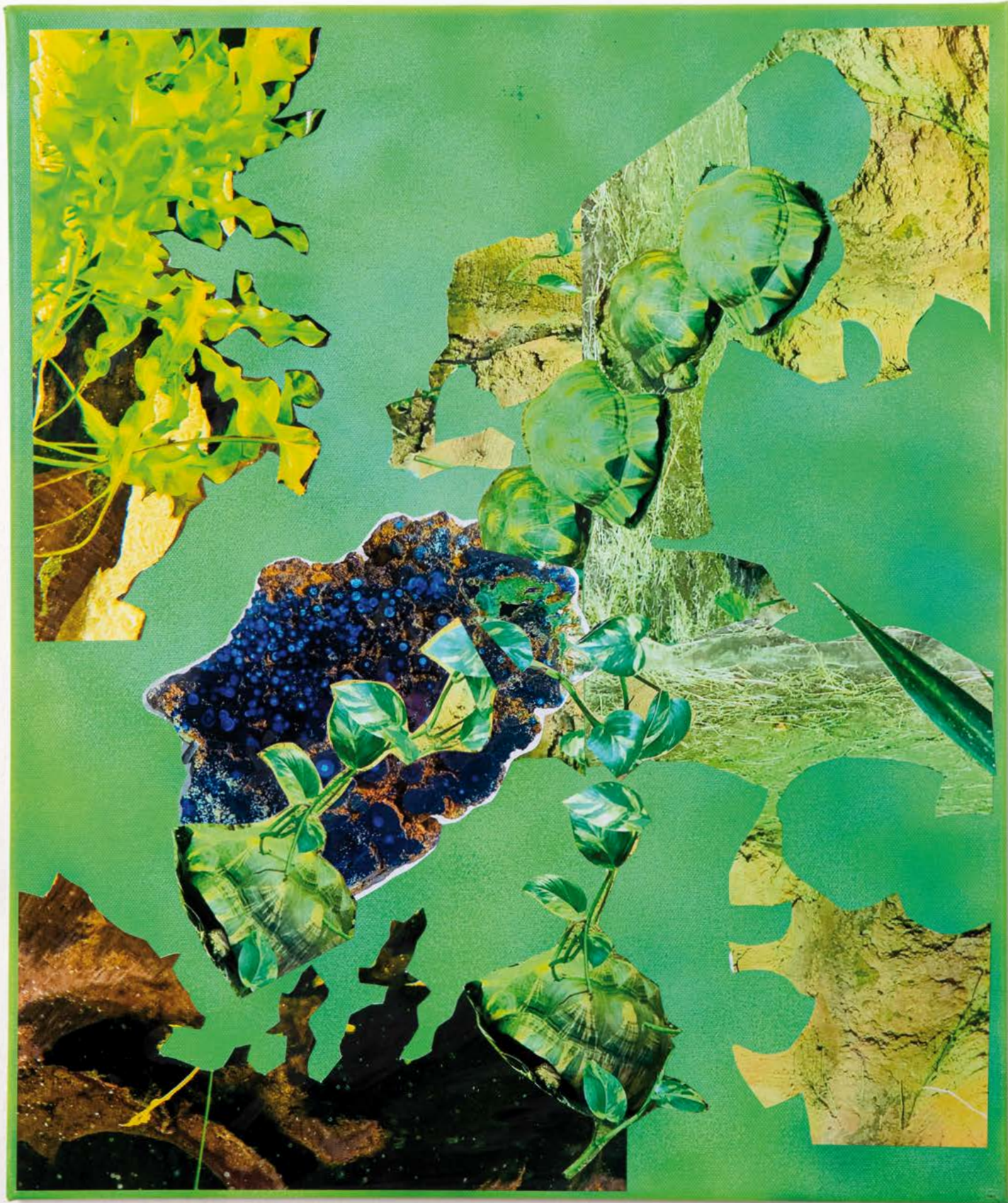
WE SAY NO