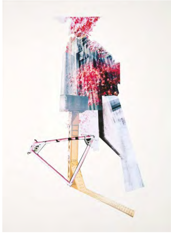
DIE WAHRHEIT HAT KEINE TEMPERATUR