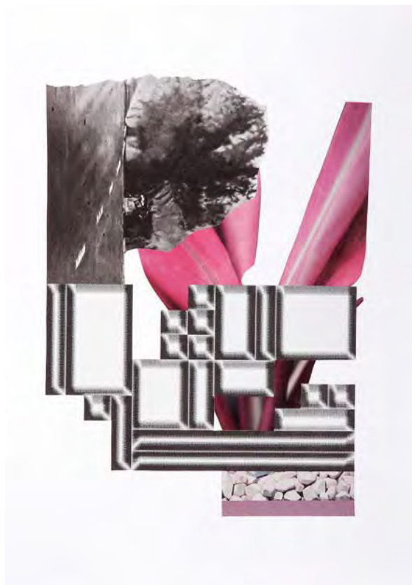
KOMPLIZIERTHEIT KOMPLIZITÄRER KOLLEKTIVITÄT