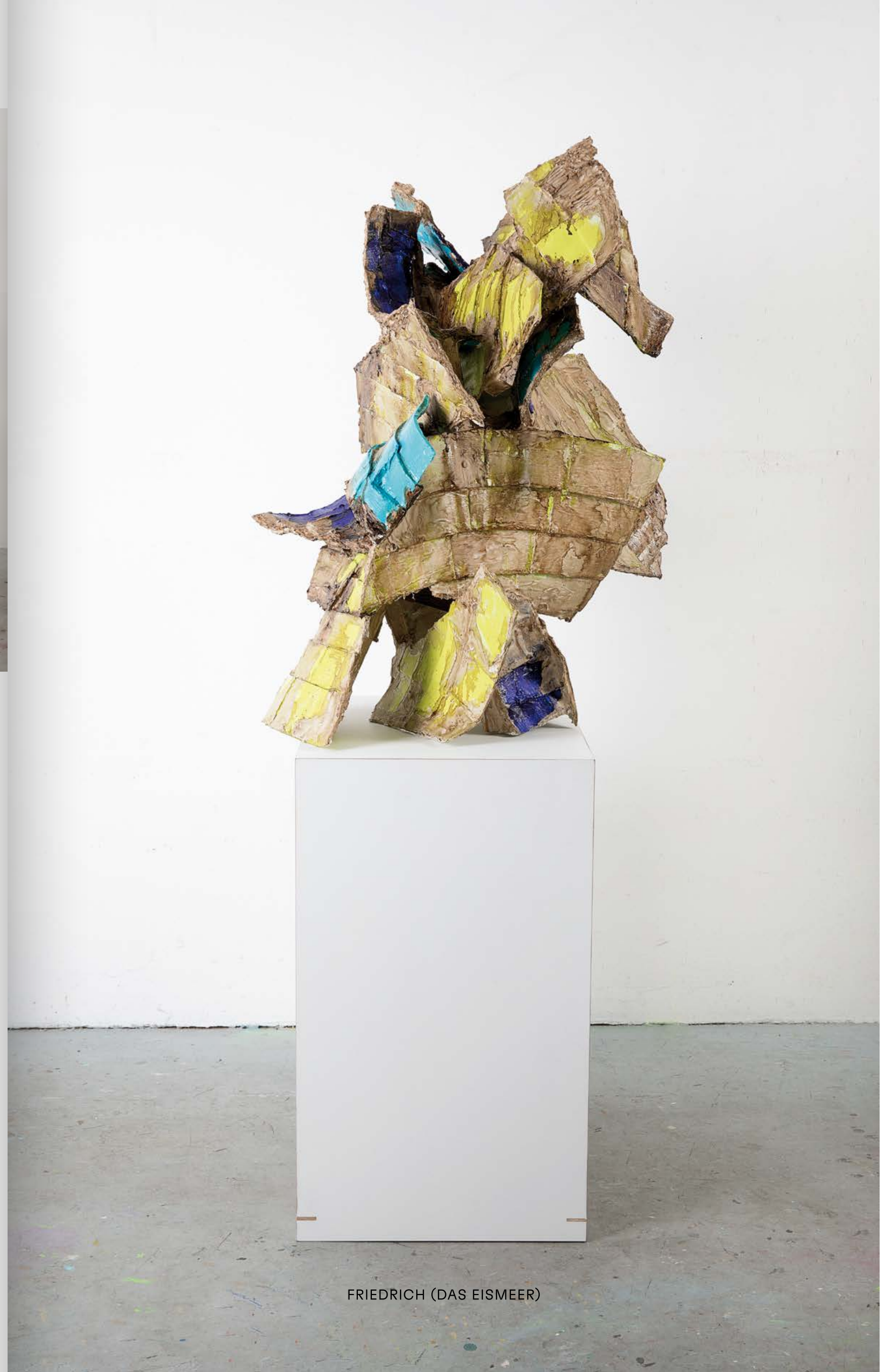
FRIEDRICH (DAS EISMEER)