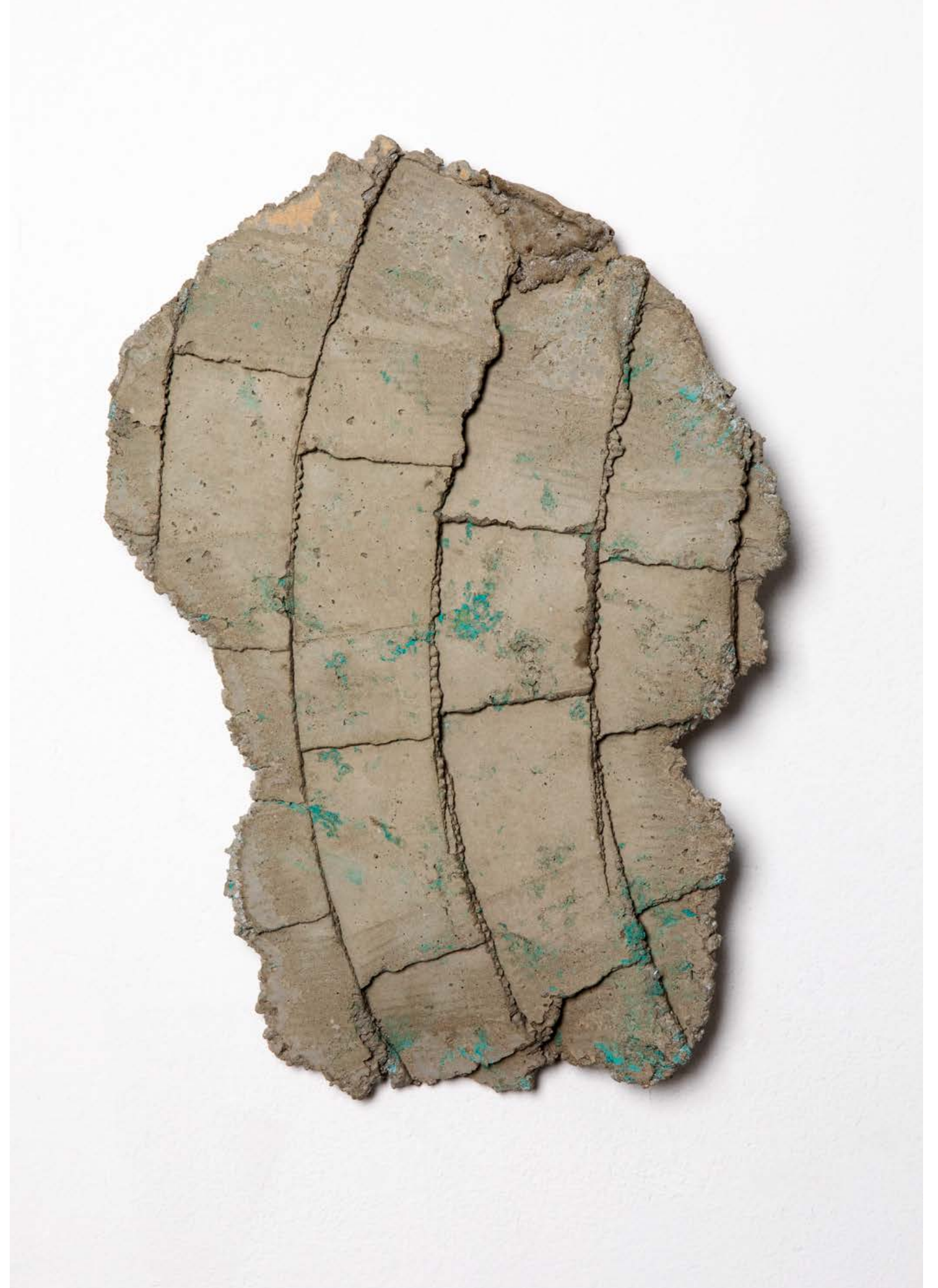
BESUCH IM NEBEL 2