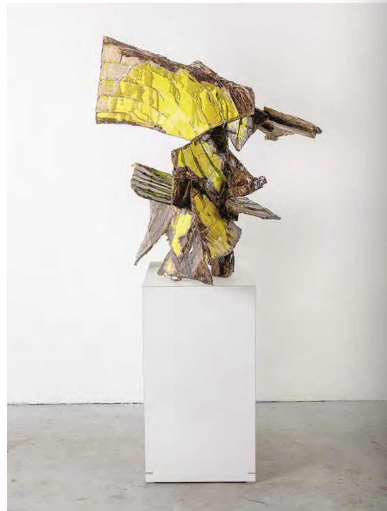
DAVID (DAS EISMEER)