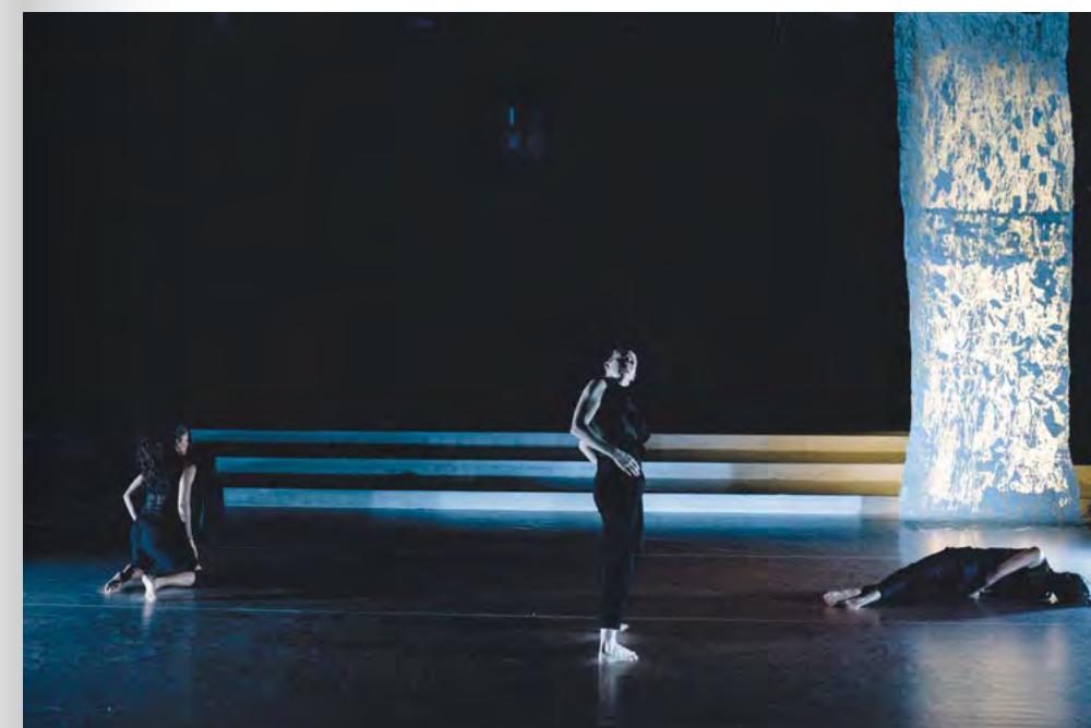
BÜHNENBILD UND REQUISITEN FÜR »CHERCHEZ LA FEMME«, COOPERATIVA MAURA MORALES