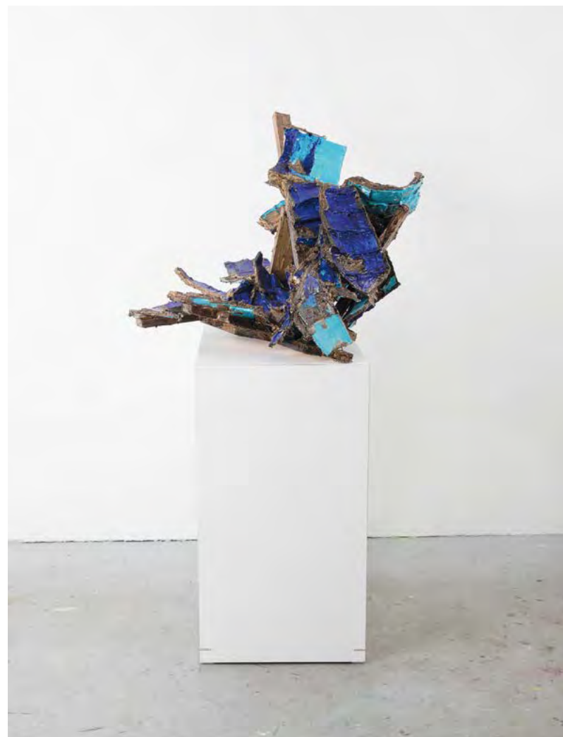
CASPAR (DAS EISMEER)