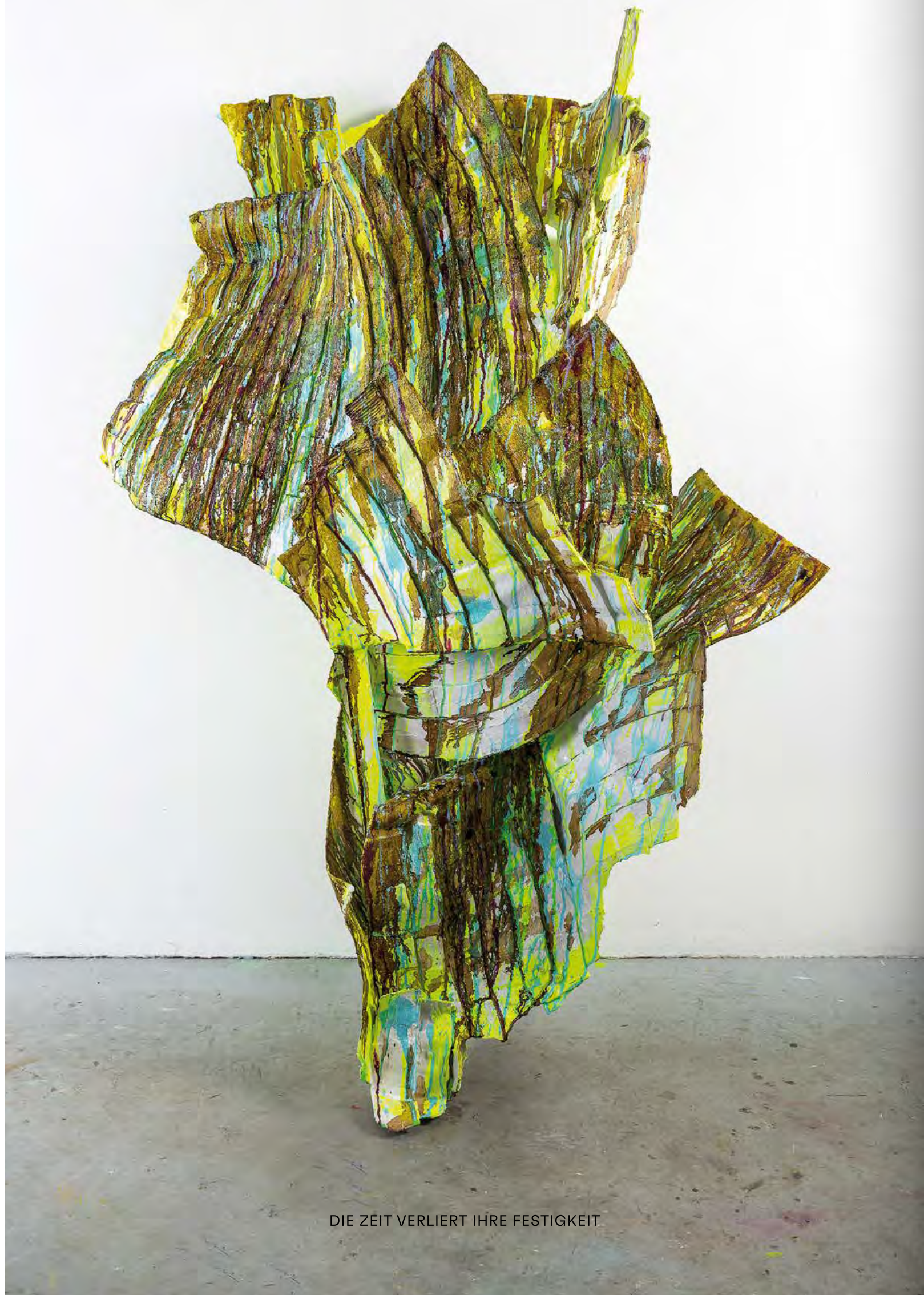
DIE ZEIT VERLIERT IHRE FESTIGKEIT