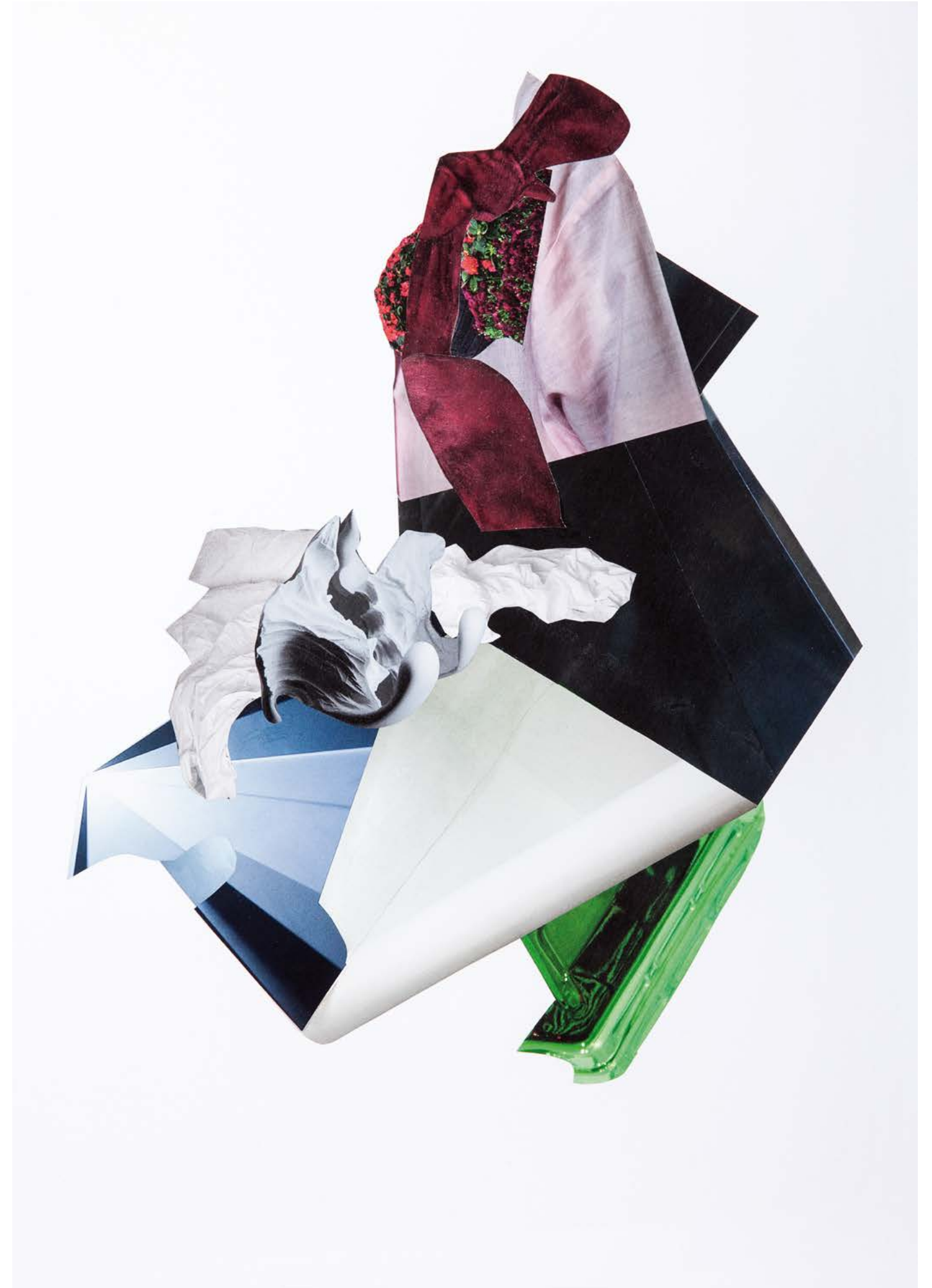
NICHT ZU ÜBERHÖREN