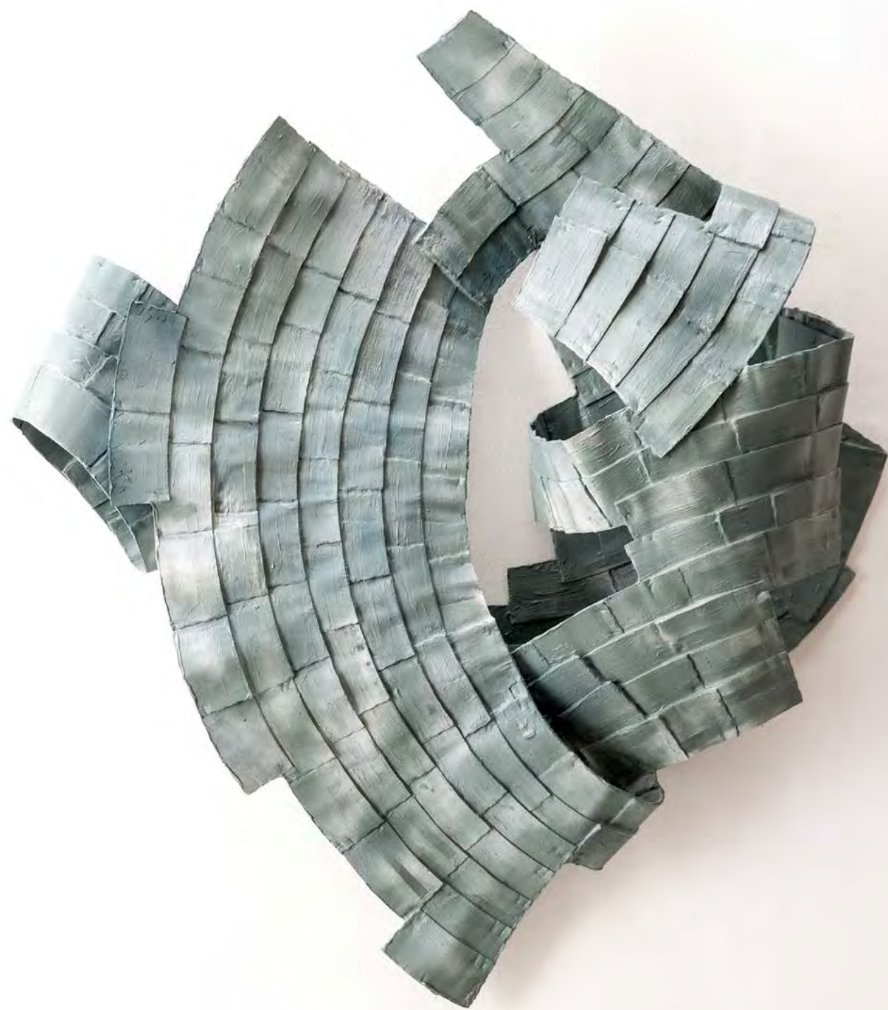
BESUCH IM NEBEL